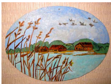
Картина-иллюстрация к рассказу «Нахаленок». Пейзажные зарисовки, навеянные произведениями М.А. Шолохова.