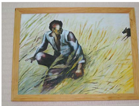
Картина-иллюстрация к рассказу «Судьба человека»